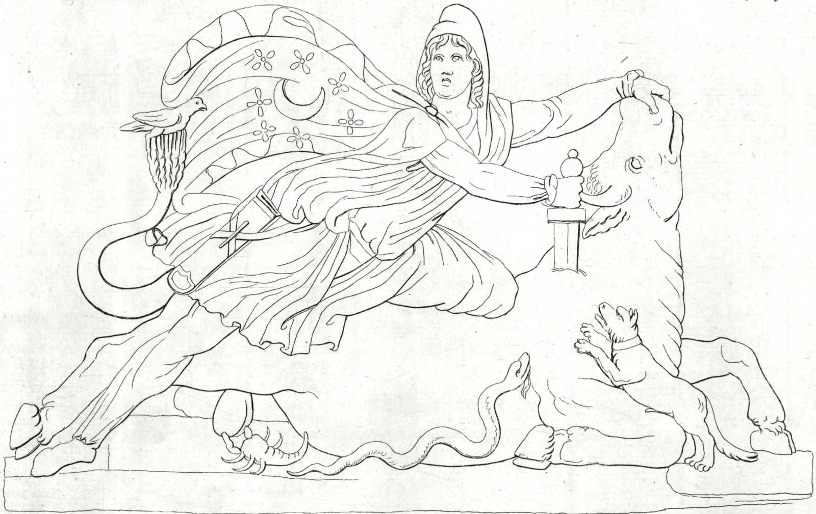
Til Afhandlingen om de Mithraiske Mysterier, af Georg Zoega, Professor.